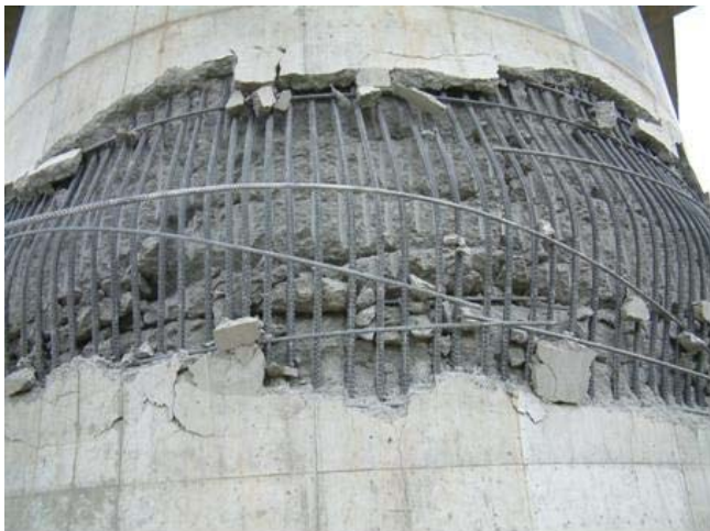
写真8 橋脚損傷部位の拡大 (新潟県中越地震[4])

写真7：3径間連続PC箱桁橋における単柱式橋脚の被害。内側の軸方向鉄筋に段落としがあり、その付近でほぼ全周に渡り、かぶりコンクリートの剥落および軸方向鉄筋のはらみ出しが見られる。