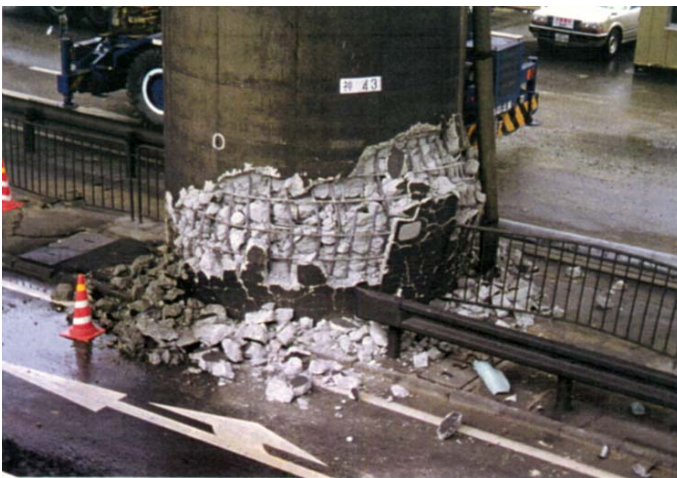
写真4 RC 橋脚基部での損傷