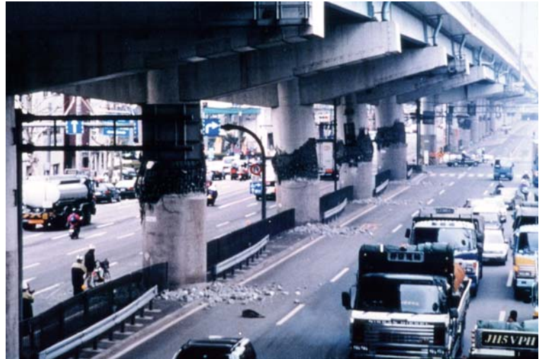
写真1 単柱式 RC 橋脚の被災：阪神高速 3 号神戸線/兵庫県南部地震

写真1左は、矩形断面の単柱式橋脚（角柱）で、橋軸方向の地震力にて完全なせん断破壊となった。段落し位置付近から斜めひび割れが進展、拡大したものと推察される。橋面にて相当量沈下し、使用不能状態となったと思われる。