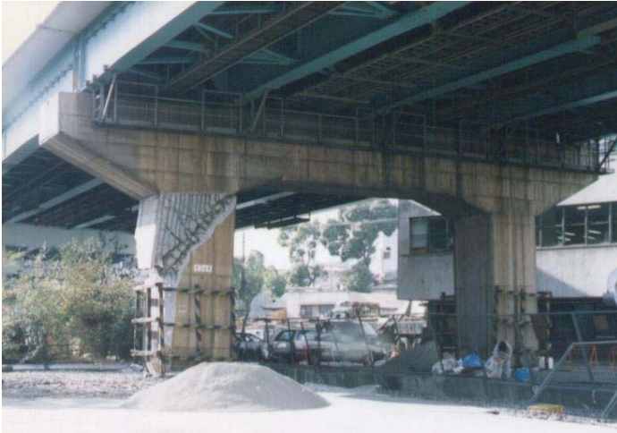
写真3 RC ラーメン橋脚の柱部の損傷