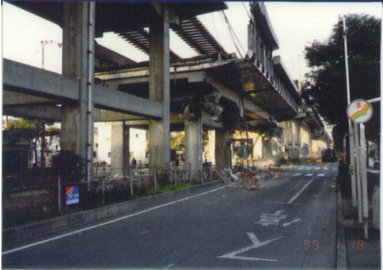
写真 5 RC ラーメン高架橋の被害

RC ラーメン高架橋は鉄道施設の標準構造として多用されるが、多くの場合、高さ 10m 以下→1 層式ラーメン構造、10m 超→2 層式ラーメン構造となる。これまでの大地震に際しては、柱部材を中心に震害を受けている。