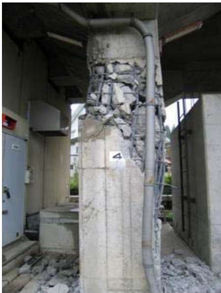
写真 6 RC ラーメン高架橋の被害例

写真 5 : 3 径間 2 層 (中間梁付き) ラーメン高架橋で、2 層目の柱部にてせん断破壊している。このため、損傷した柱は支持能力を失い、2 層目が完全に崩壊。写真手前のラーメン高架橋は損傷がなく、このため、軌道部が中吊状態となった。