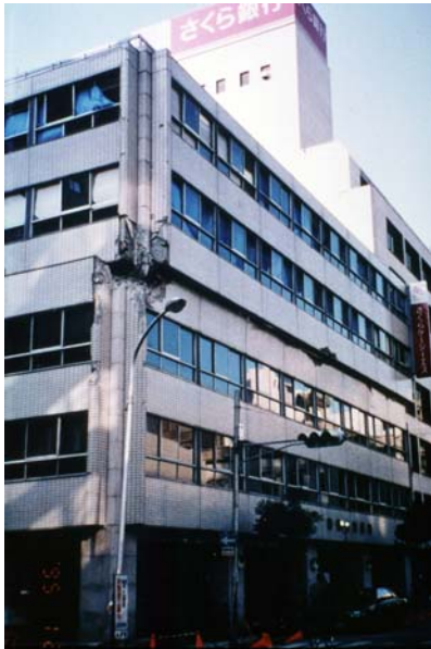
写真 10 : RC 造建物の中間層崩壊の例 (兵庫県南部地震[2])