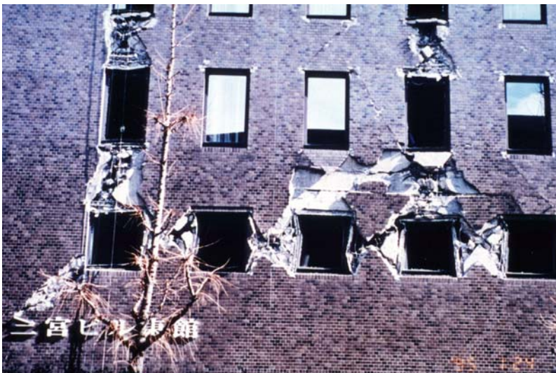
写真 11 : RC 造建物のせん断破壊の例 (兵庫県南部地震[2])

写真 10 : 4 層目のみ崩壊し、他の階には目立った損傷は見られない。特定の一層のみが崩壊するいわゆる中間層破壊であり、兵庫県南部地震では中層建物を中心に多く生じた。