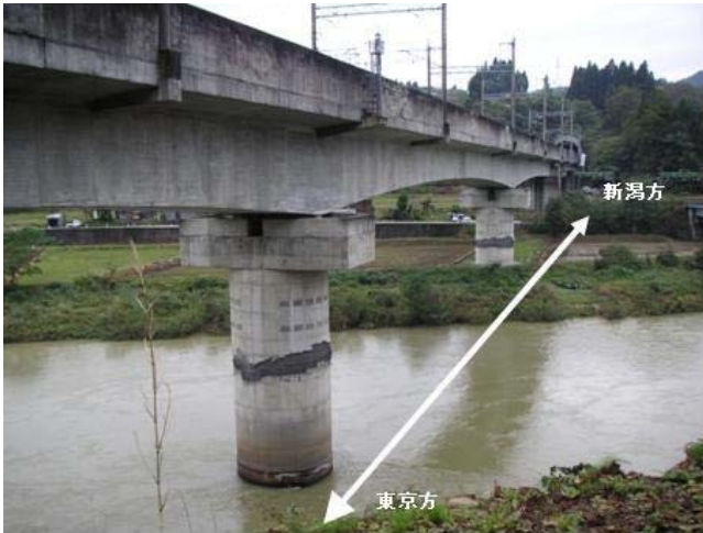
写真7 連続橋梁の被害 (JR 上越新幹線/新潟県中越地震[4])

写真7：3径間連続PC箱桁橋における単柱式橋脚の被害。内側の軸方向鉄筋に段落としがあり、その付近でほぼ全周に渡り、かぶりコンクリートの剥落および軸方向鉄筋のはらみ出しが見られる。